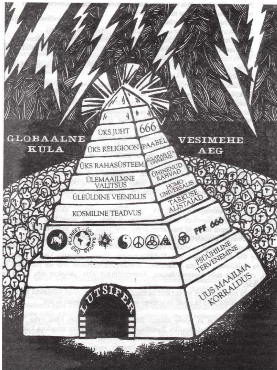
Joon. 7. Moodne Paabeli torn.

* Maailma liidri jumalikustamine, nii nagu seda tehti vana-aja Nimrodi puhul. Ta valitseb tihedas koostöös usuliste juhtidega.