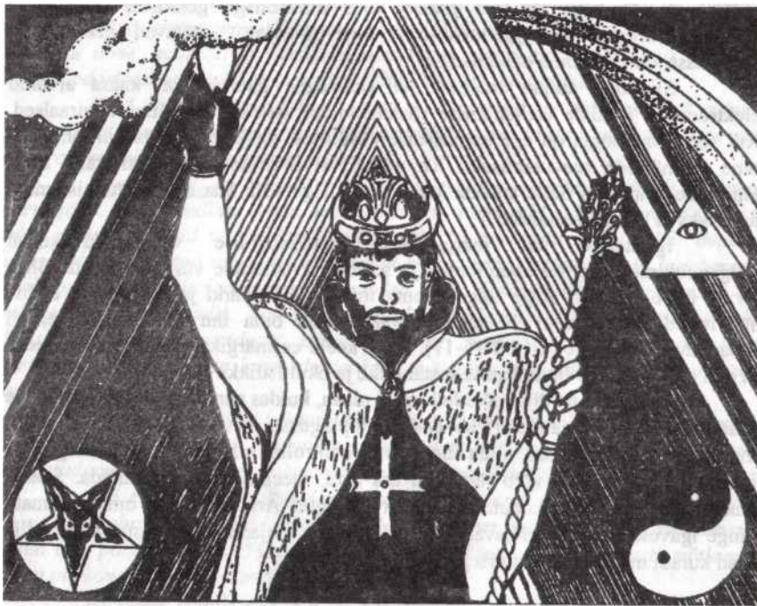
Joon. 6. Hukatuse poeg, kes viib maailma oma pahelise doktriiniga eksiteele.

Antikristus loob ühtse maailma, kaotades ära piirid ja suunates erinevaid rahvusgrupe sõlmima vastastikuseid lepinguid. Lõppresultaadiks on üks klass planeedi elanikke, kes on minetanud oma rahvuslikud tunnused. Poliitikas rõhutatakse uut maailmakorraldust, mis saavutatakse ülemaailmse valitsuse rajamisega ja keskse kontrolliga majanduse üle. Oikumeeniline liikumine rajab aluse maailma religioonide ühinemiseks. Uus religioosne liit on lähedases koostöös ülemaailmse valitsusega.